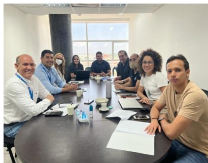
Primera sesión 2022 del Comité Territorial de Rendición de Cuentas del Departamento del Atlántico