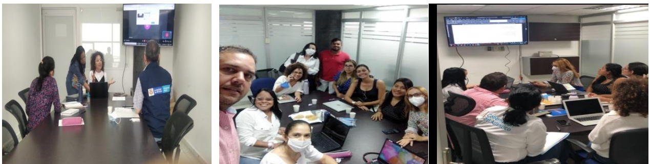
Mesas de trabajo para la conformación del Nodo de Rendición de Cuentas para los jóvenes, en la que participaron funcionarios de diferentes Entidades.

Con el propósito de dar a conocer la operación del Sistema Nacional de Rendición de Cuentas, así como las ventajas de la creación de Nodos de Rendición de Cuentas, la Secretaría Técnica del Comité Territorial, ha realizado reuniones de trabajo en las que se ha socializado el Decreto 230, sus objetivos, principios, como está organizado y quienes conforman el Sistema, entre otros aspectos, con entidades del orden Departamental como lo son el Servicio Nacional de Aprendizaje - SENA, Prosperidad Social, Universidad del Atlántico, Instituto Colombiano de Bienestar Familiar - ICBF e internamente con algunas las dependencias de las Gobernación.