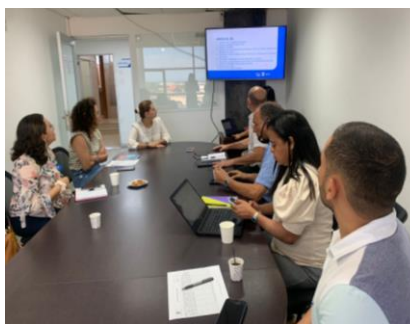
Segunda sesión 2022 del Comité Territorial de Rendición de Cuentas del Departamento del Atlántico