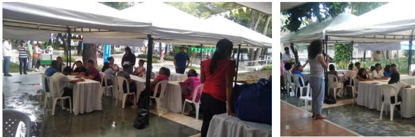
Imagen de jóvenes del Sistema de Responsabilidad Penal Adolescente reunidos en mesas de trabajo