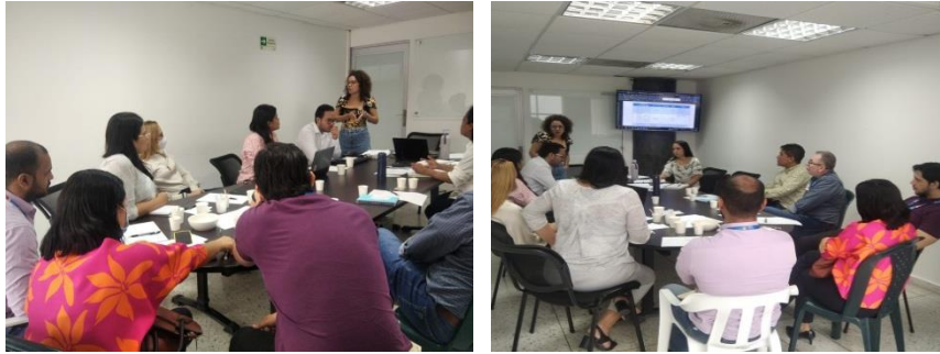
Mesa de trabajo con las entidades que conforman el Nodo “Rendición de Cuentas para la Juventud del Atlántico”

Se tiene propuesto realizar el ejercicio de dialogo del Nodo “Rendición de Cuentas para la juventud del Atlántico” en el primer semestre del 2023, de manera que las Entidades tengan consolidados los resultados sobre la ejecución de sus metas a diciembre 2022.