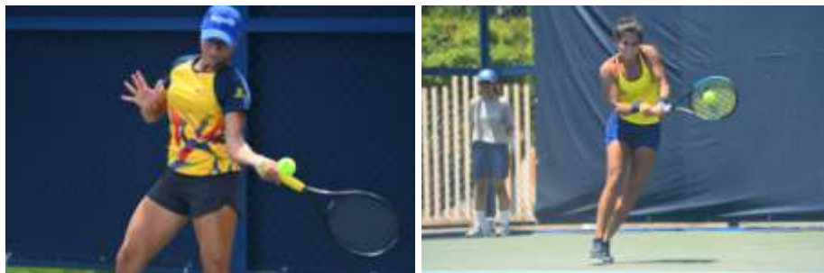
Parada Mundial De Kitesurf – 2023

Indeportes respaldó activamente este evento que impulsó el turismo deportivo en el departamento. La competencia, que se llevó a cabo del 1° al 5 de marzo, atrajo a destacados kitesurfistas de todo el mundo. Con la asistencia de más de 25 mil visitantes, se espera que este evento haya tenido un impacto positivo en la economía local, beneficiando a hoteles, restaurantes y agencias de turismo. Indeportes se comprometió a fortalecer el desarrollo del turismo deportivo en la zona costera del Atlántico.