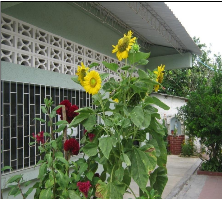
SEDE N° 3 VEREDA DE MEGUA