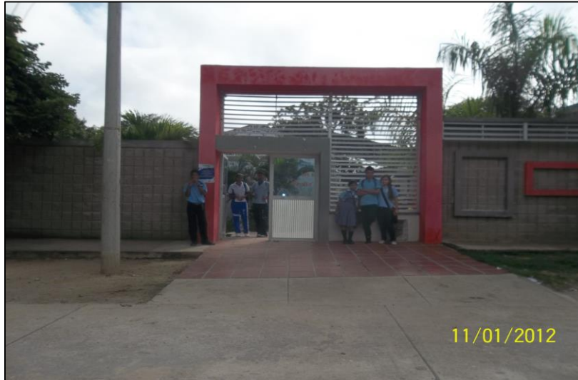
SEDE N° 2 M.