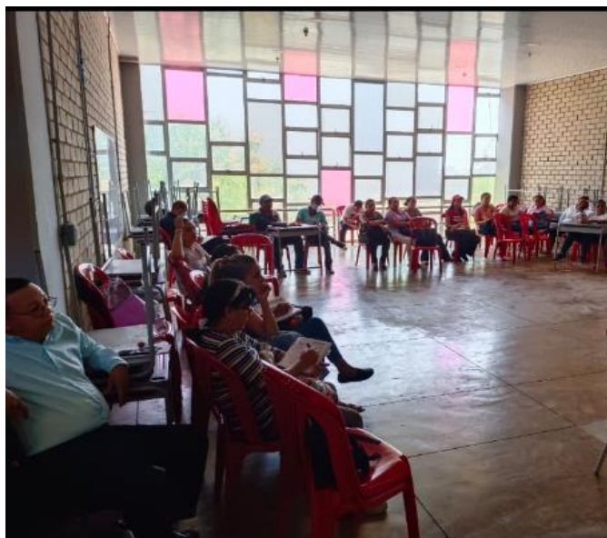
Figura 2. Reunión con el equipo docente durante la semana de desarrollo institucional para el direccionamiento estratégico institucional y elaboración del PMI.

De igual forma, se realizó direccionamiento a los docentes para la elaboración de la autoevaluación institucional, el PMI, actualización de la visión institucional.