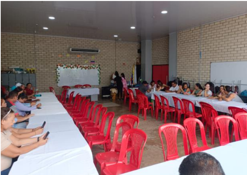
Figura 21: Celebración del día del docente, por parte de consejo de padres.

DANE: 108296800002 NIT: 901049832 – 1 Resolución de aprobación: 0189 del 25 de enero de 2017 Modificada por la resolución 1948 del 9 de noviembre de 2018. Email: ievillaolimpica@gmail.com