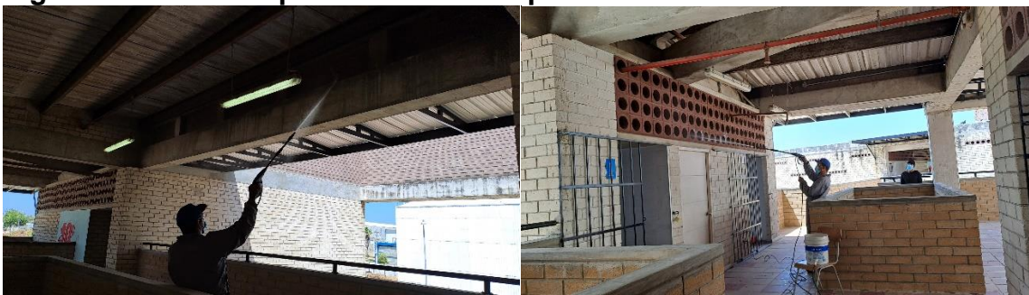
Figura 8: Mantenimiento de parque de transición

¡EDUCACIÓN PARA EL DESARROLLO HUMANO! Dirección: Carrera 59 N° 5 – 02 Galapa – Atlántico. Versión II – Junio. 2019