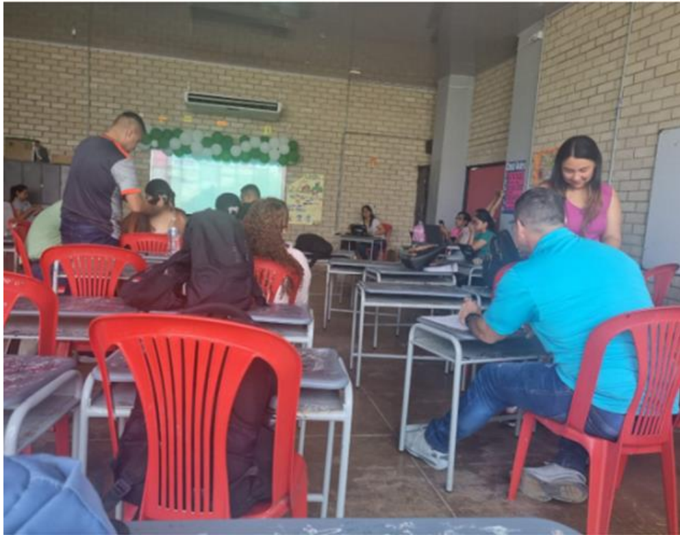
Figura 25: Presentación de proyectos semana de la creatividad y la convivencia

DANE: 108296800002 NIT: 901049832 – 1 Resolución de aprobación: 0189 del 25 de enero de 2017 Modificada por la resolución 1948 del 9 de noviembre de 2018. Email: ievillaolimpica@gmail.com