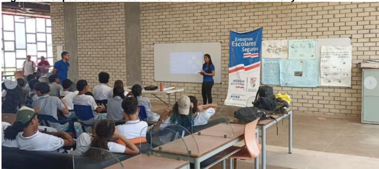
Figura 33. Capacitación en convivencia con estudiantes de 10° y 11°