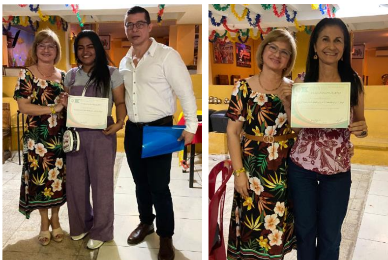
Figura 20 : Capacitación en movilidad, dictada por la gobernación