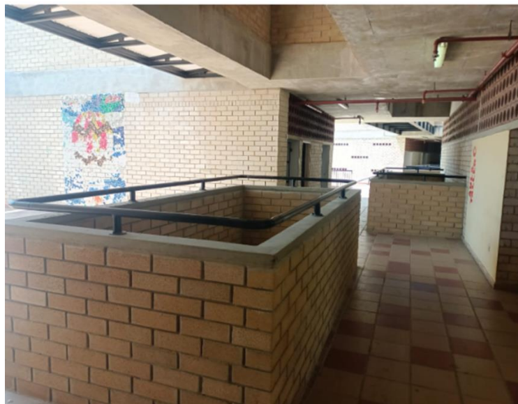
Figura 4 : Reemplazo de barandas.