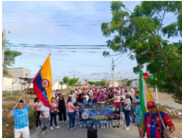
Figura 29: Jornadas ambientales llevadas a cabo por la comunidad educativa.

Figura 28: Participación masiva de la comunidad en inauguración de juegos intercursos.